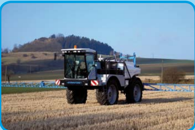
Bräutigam Hydrotrac mit Aufbauspritze 6500 L, 30 m