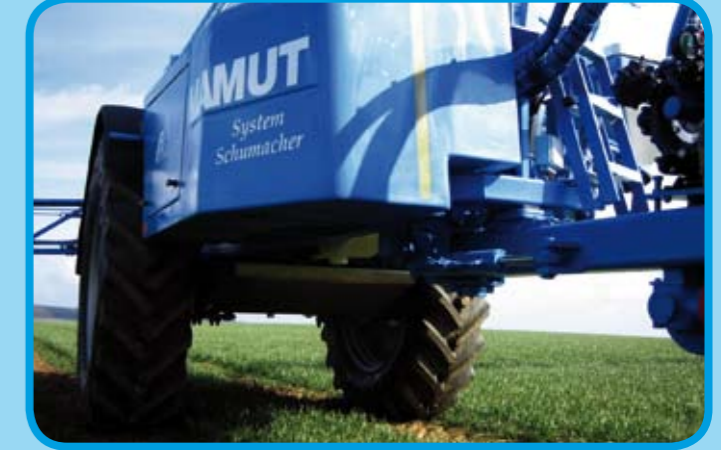
Manueller oder automatischer Nachlauf der Spritze über eine Lenkdeichsel*