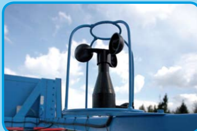
Windmesser zur gezielten Abdriftvermeidung*

Alle Maschinen BBA erklärt, Nr. 1533, Betriebserlaubnis bis 40km/h Umfangreiche Garantiebedingungen. Weitere Sonderausstattungen, Spezialgestänge für Sonderkulturen und vieles mehr auf Anfrage.