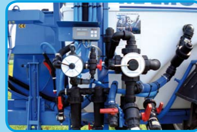
Übersichtliche und einseitige Bedienung der Spritze