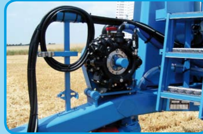
AR-Spritzpumpen von 250 L – 370 L