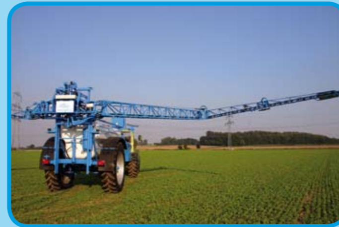
Absolut synchrones Einklappen, auch in schwierigen Hanglagen