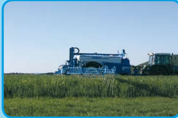
Schleppschlauchanlage in 50 cm oder 25 cm Abstand*