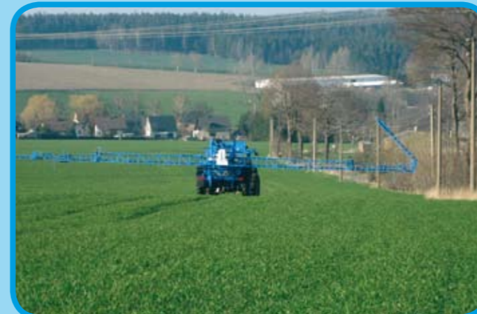
Symetrische und Asymetrische Teilkklappung*