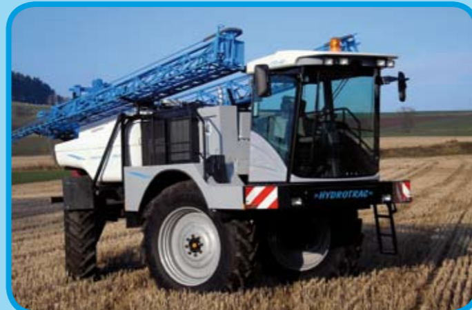
Bräutigam Hydrotrac mit Aufbauspritze 6500 L, 30 m