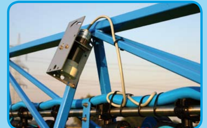
Automatische Gestängeführung über Parallelomat oder Distance-Control*