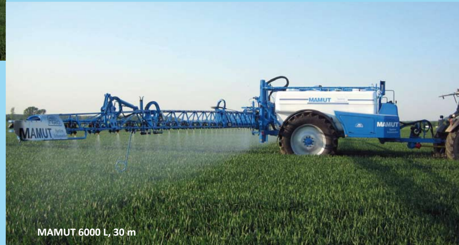
MAMUT 6000 L, 30 m