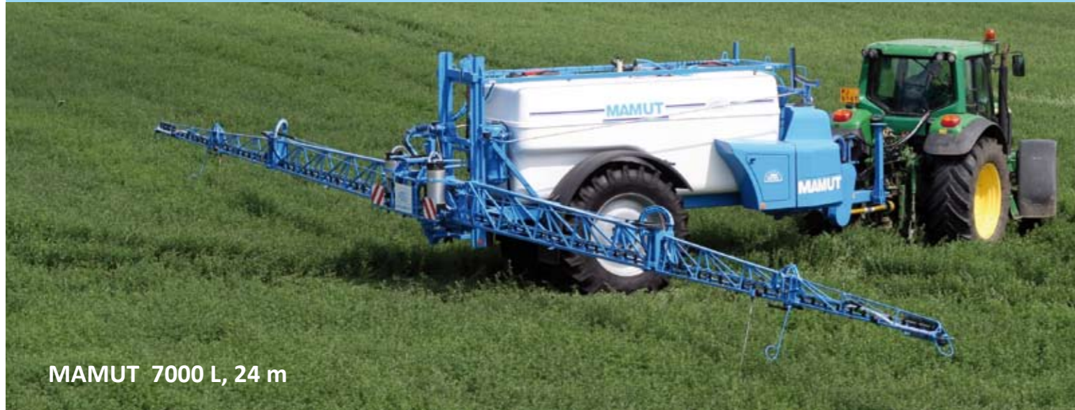
MAMUT 7000 L, 24 m