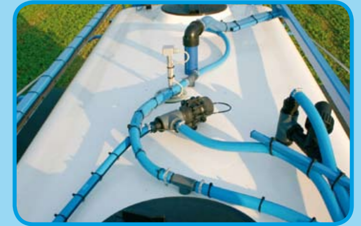
AGRIO-Pneumatik zur kompletten Regelung der Spritze