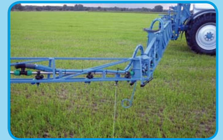
3 m Anfahrssicherung nach vorne und hinten