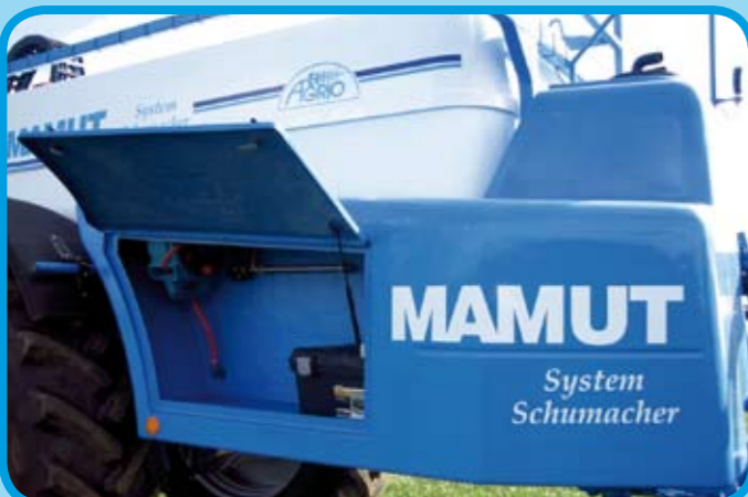
Großer Frischwasserbehälter mit integriertem Stauraum und Außenwaschanlage