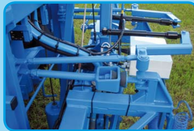
Stabile Gestängelage durch optimale Dämpfungskinematik