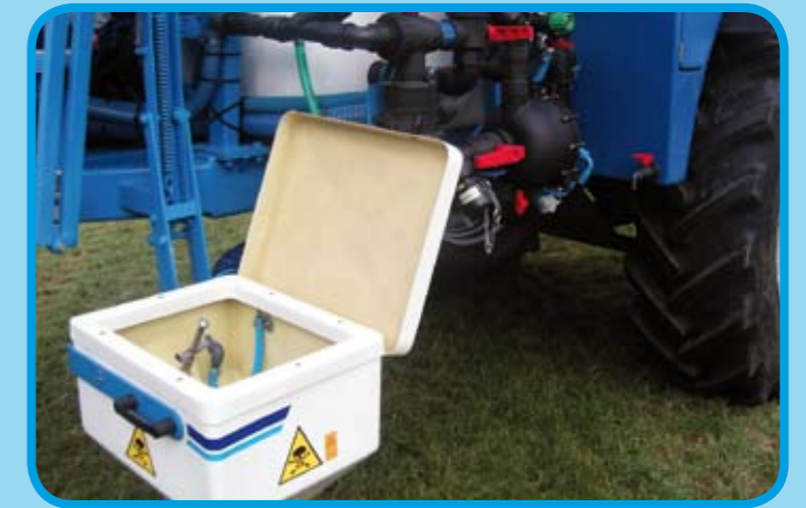
Hochklappbare Comfort Einspülschleuse