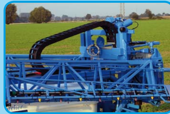
Zentrale Schlauchführung im Hubmast über Gliederkette