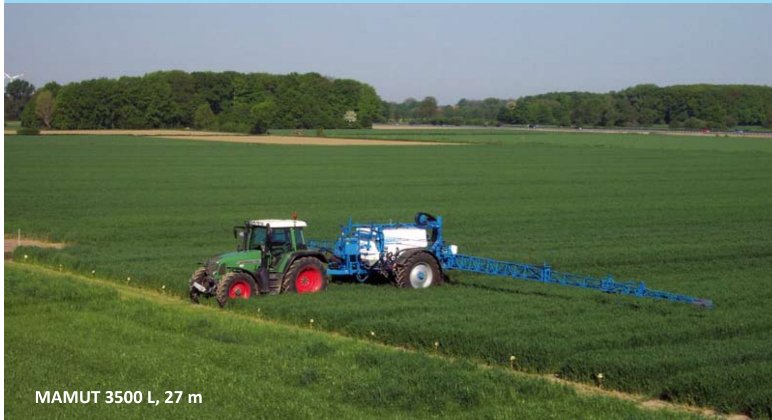
MAMUT 3500 L, 27 m