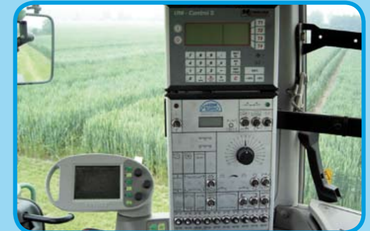
Rechnerausstattung nach Wunsch