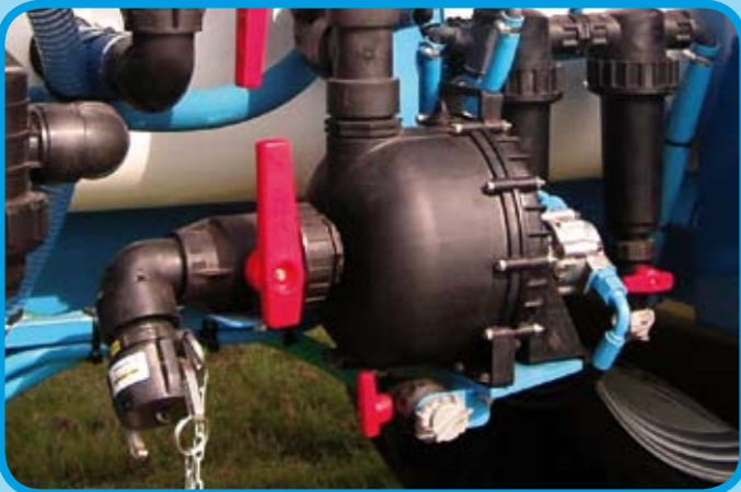
Befüllpumpe bis 800 L/min*