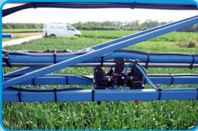
Pneumatische EinzeldüSENSCHALTUNG, auch mit MehrfachdüSENKÖRPERN und Section-Control*