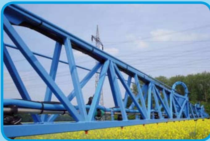
Dreieckskonstruktion für beste Stabilität