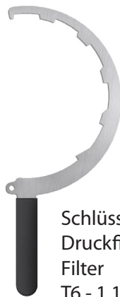
Schlüssel Druckfilter Filter T6 - 1 1/2"