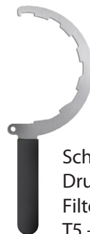
Schlüssel Druckfilter Filter T5 - 1 1/4"