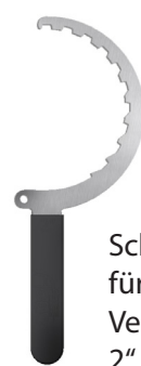
Schlüssel für Ventil 2"