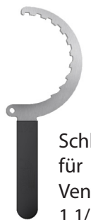
Schlüssel für Ventil 1 1/2"