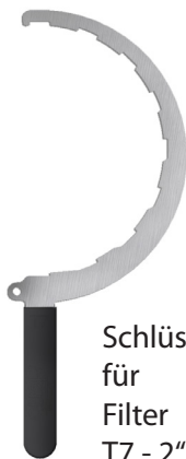
Schlüssel für Filter T7 - 2"