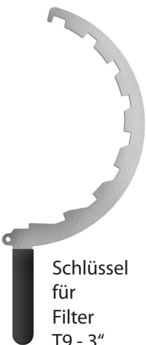
Schlüssel für Filter T9 - 3"